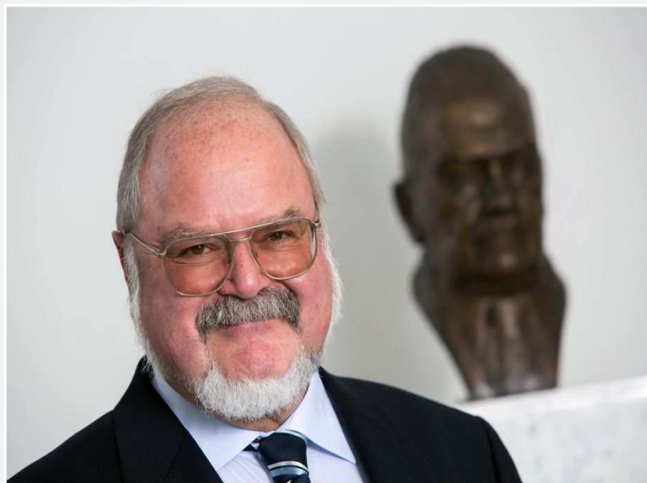
KATHREIN Passion to connect